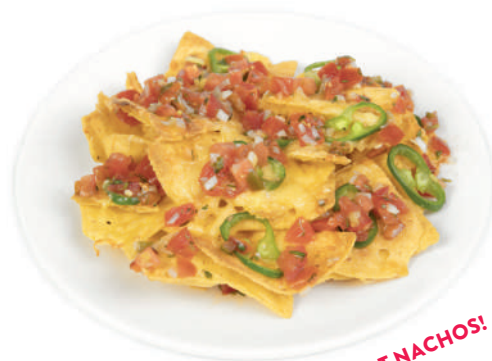
WEST COAST NACHOS!